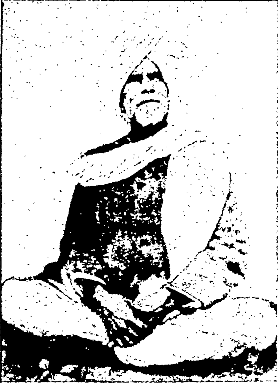
श्री धन्ना भगत जी